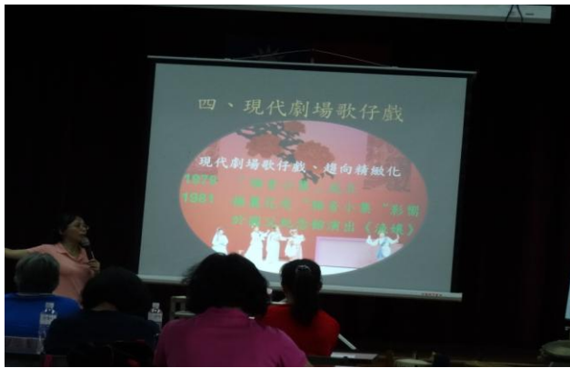
活動內容：資訊媒材在傳統戲曲的應用 (I)-3