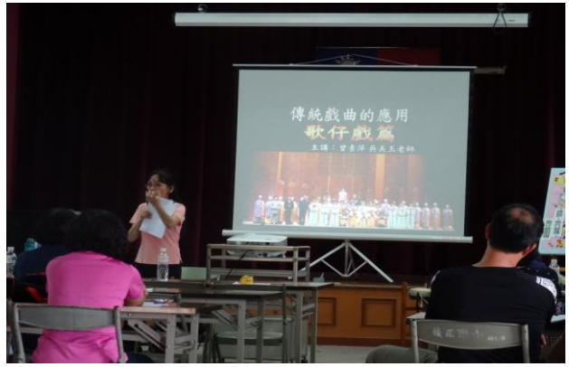
活動內容：資訊媒材在傳統戲曲的應用 (I)-2