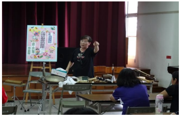
活動內容：資訊媒材在傳統戲曲的應用 (II)-1