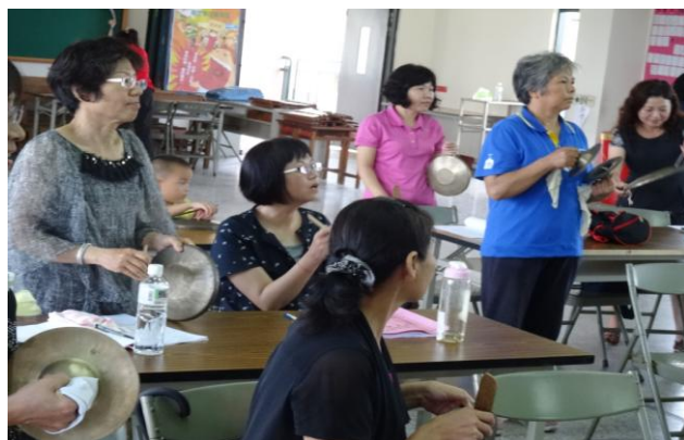
活動內容：資訊媒材在傳統戲曲的應用 (II)-3