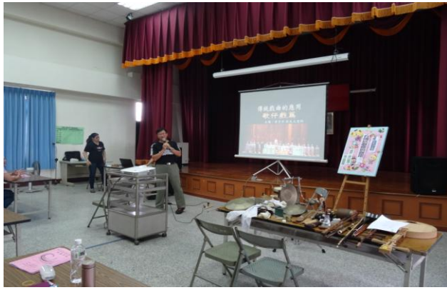
活動內容：資訊媒材在傳統戲曲的應用 (I)-1