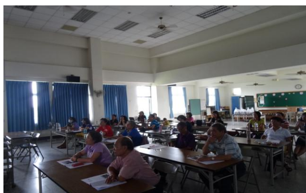
活動內容：資訊媒材在本土兒童文學的應用 (II)-3