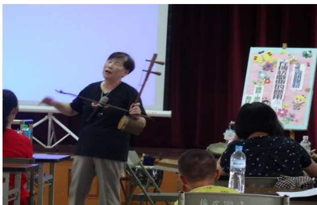
活動內容：資訊媒材在傳統戲曲的應用 (II)-2