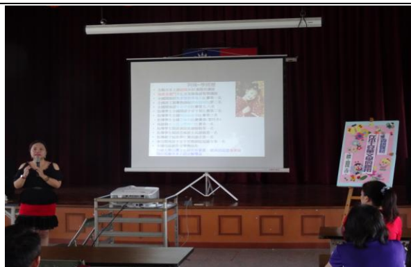
活動內容：資訊媒材在本土兒童文學的應用 (I)-1