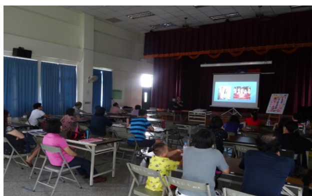
活動內容：資訊媒材在本土兒童文學的應用 (II)-2