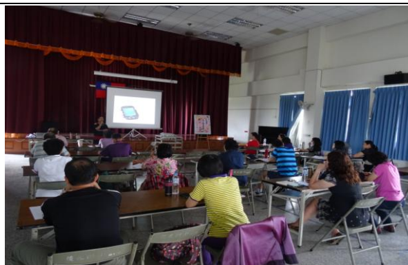
活動內容：資訊媒材在本土兒童文學的應用 (I)-2