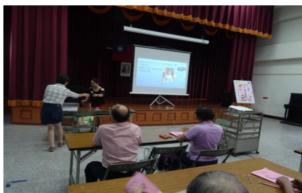
活動內容：資訊媒材在本土兒童文學的應用 (II)-1