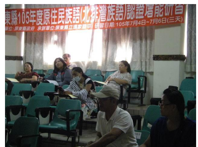
照片說明：研習情形實況