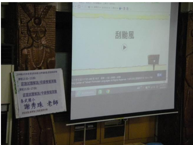
照片說明：族語研習教材內容