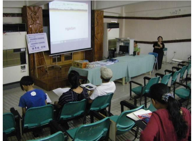
照片說明：研習情形實況