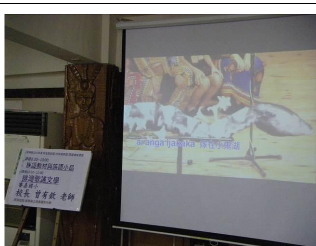
照片說明：族語研習教材內容