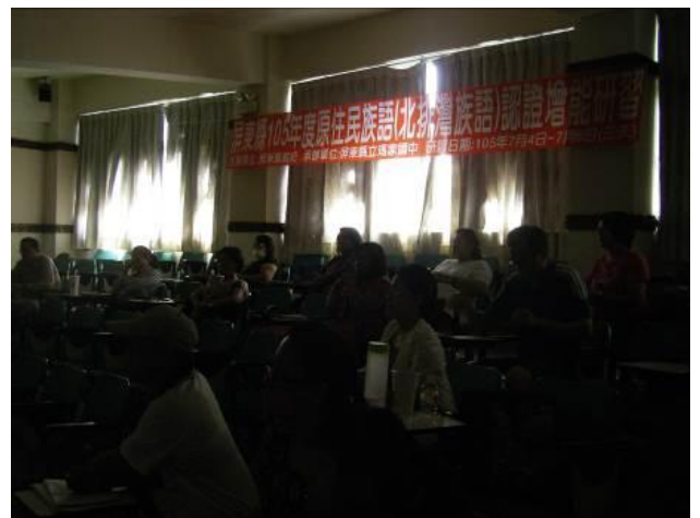
照片說明：研習情形實況