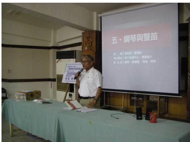
照片說明：講師與學員互動情形