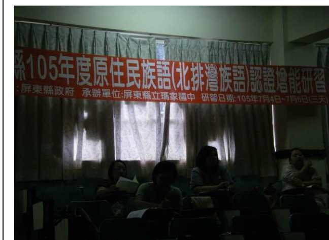
照片說明：學生作品成果