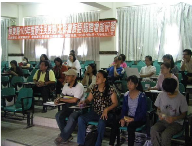
照片說明：研習情形實況