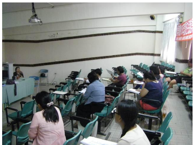
照片說明：研習情形實況