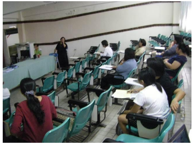
照片說明：研習情形實況