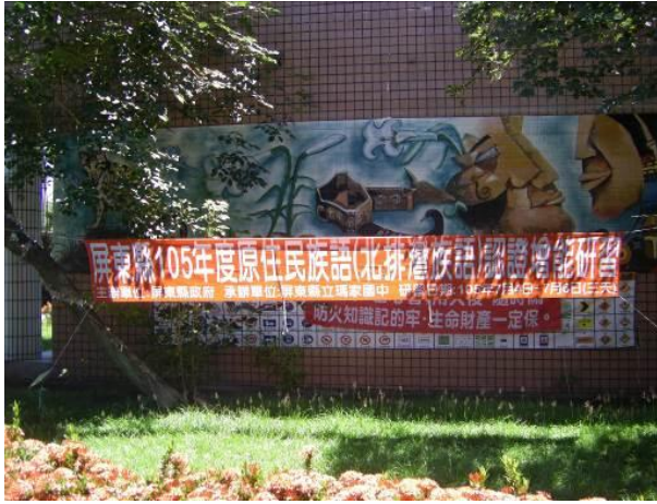
照片說明：研習布條