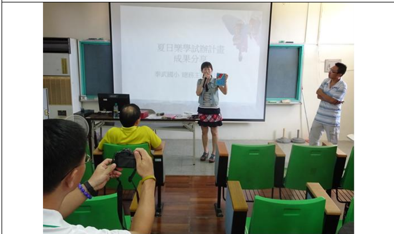
說明：秀鳳主任分享辦理成果之一