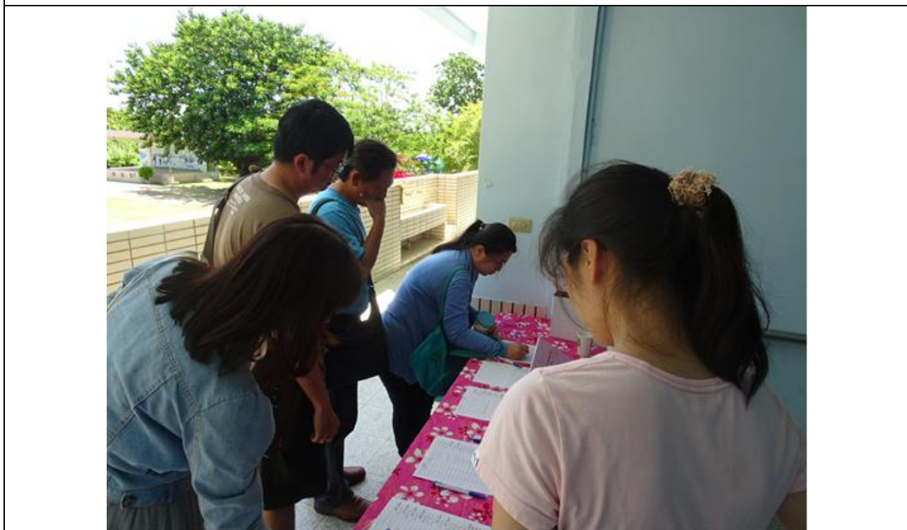
說明：工作人員親切協助報到服務