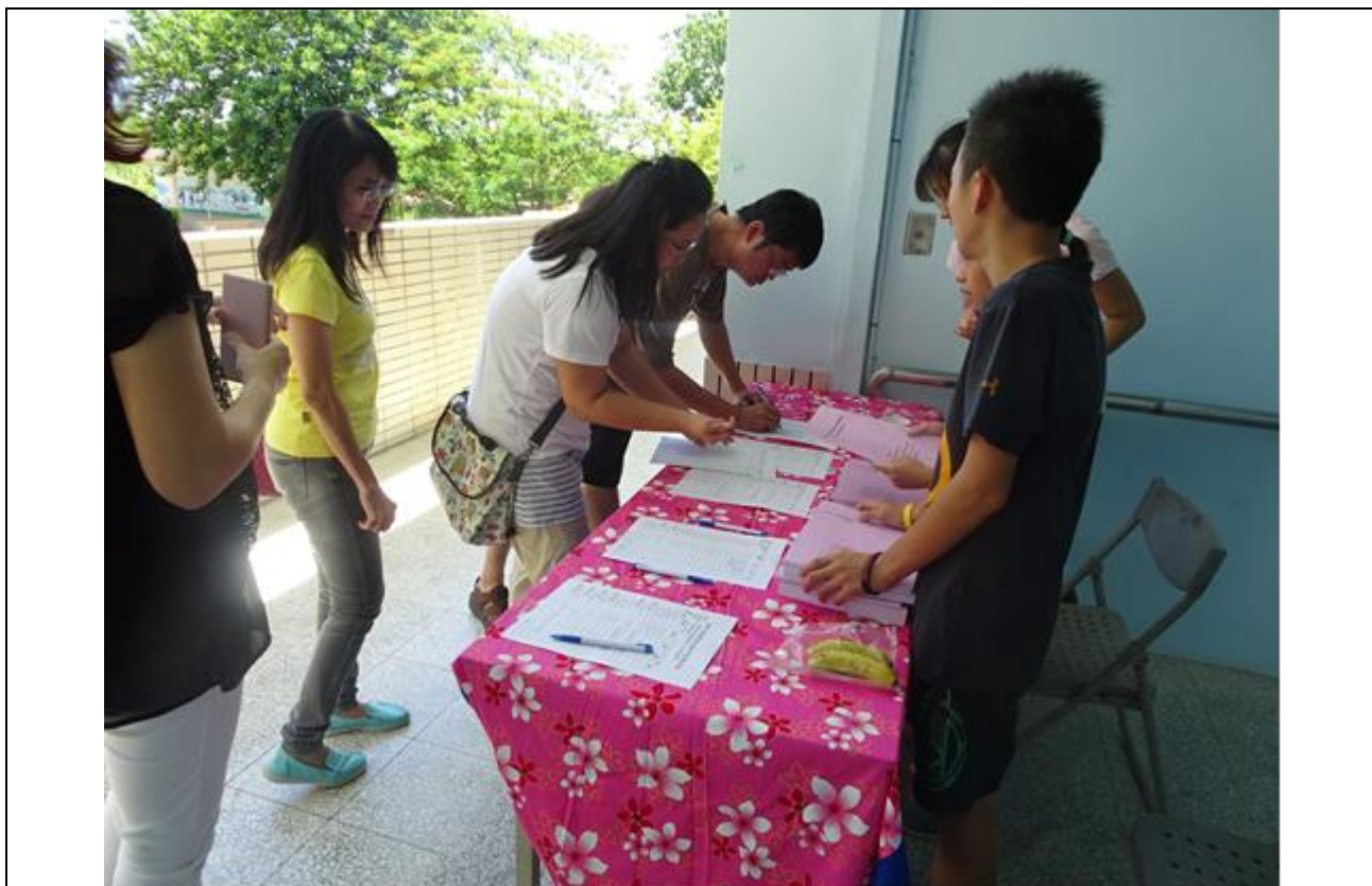
說明：報到情形踴躍