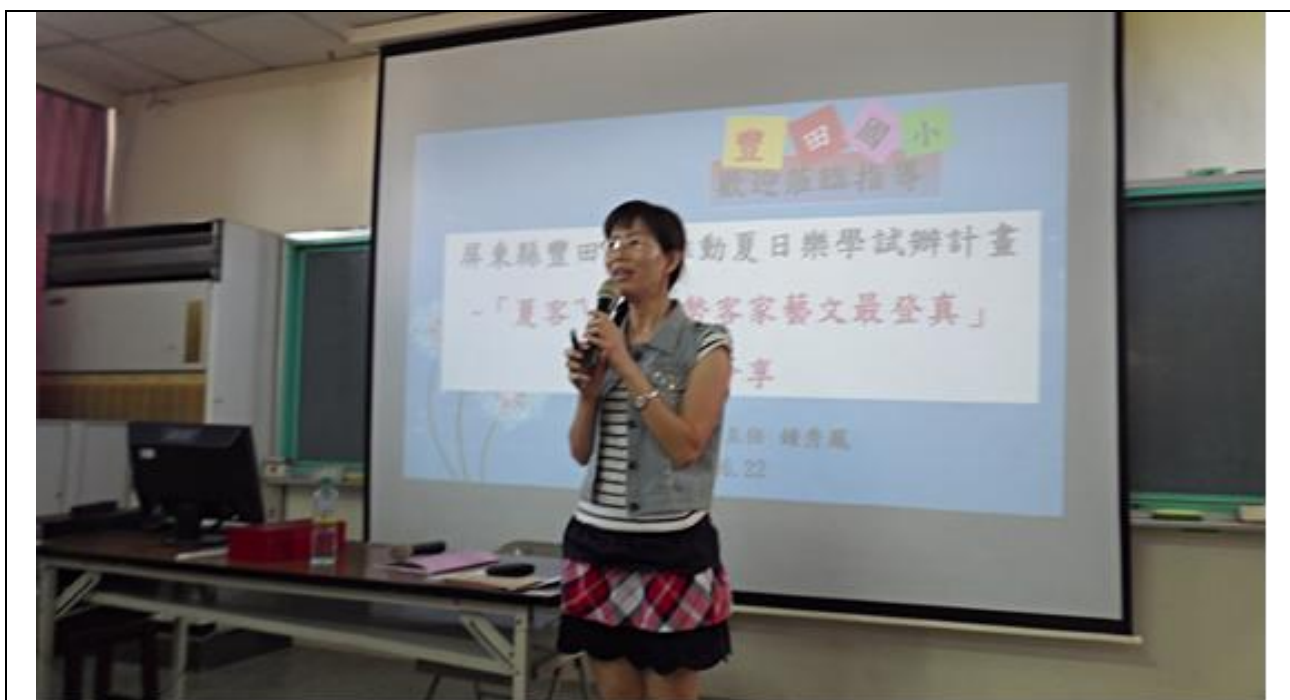
說明： 豐田國小秀鳳主任分享客家語學校申辦經驗