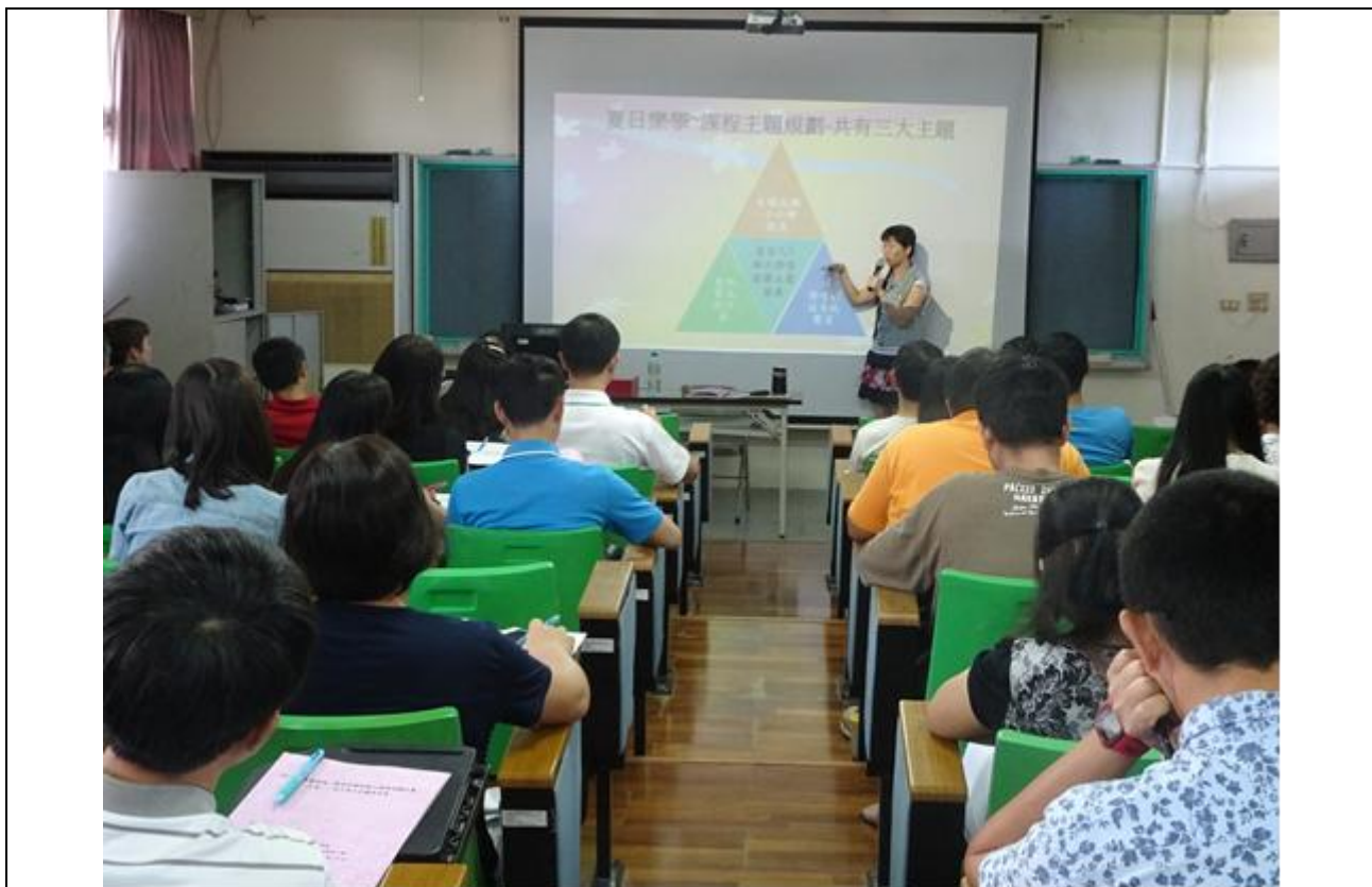
說明：秀鳳主任分享課程主軸大綱