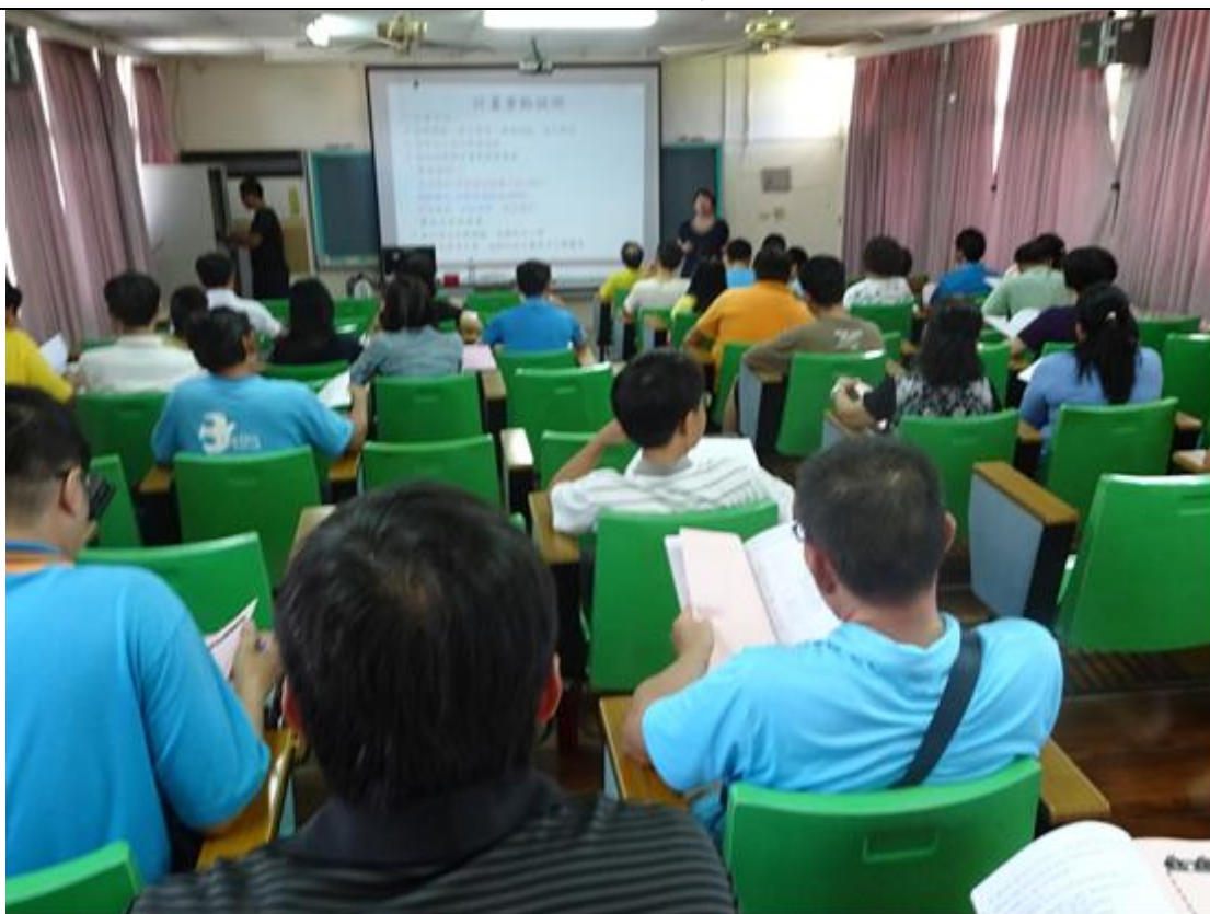
說明： 大家都很有仔細聆聽