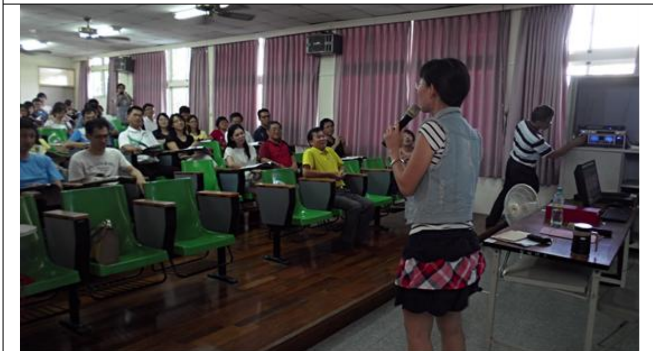
說明： 師長們都很用心聆聽重點